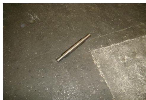
GP-Verschrote onderdelen 10