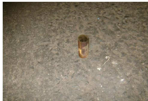
GP-Overtollige stuk metaal 01